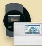
Solar-Log™ et Meteocontrol WEB'log Accessoires