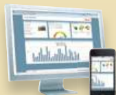
StecaGrid Portal* Portail Internet