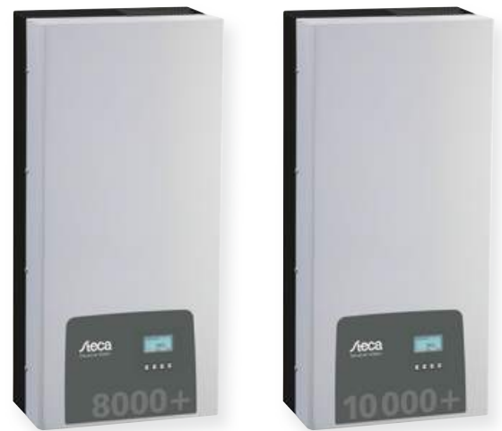
StecaGrid 8000+ 3ph