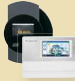
Solar-Log™ et Meteocontrol WEB'log Accessoires