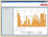
StecaGrid User Logiciel de visualisation